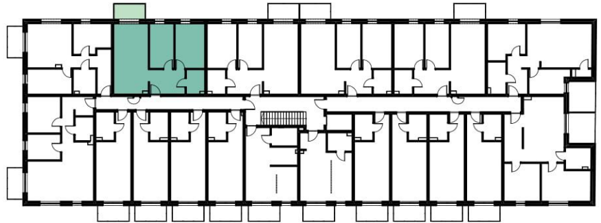
I PIĘTRO SKALA 1:500