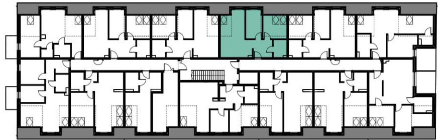
II PIĘTRO SKALA 1:500