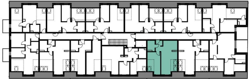
II PIĘTRO SKALA 1:500