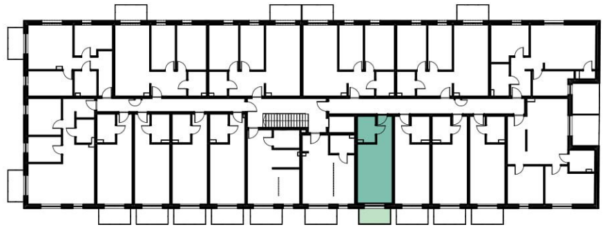
I PIĘTRO SKALA 1:500